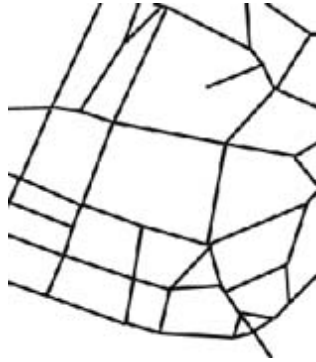
그림 1. 지도(왼쪽)를 칩상(오른쪽)에 표현